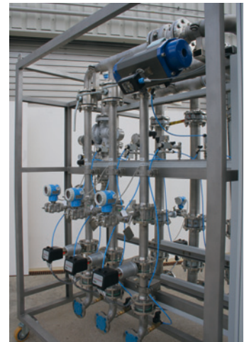
Regelanlage für Oxy-Fuel-Brenner